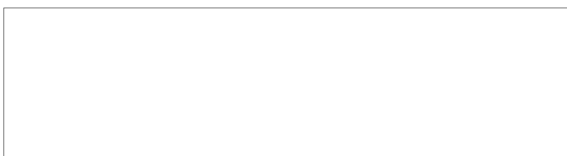
KDK 4 sand